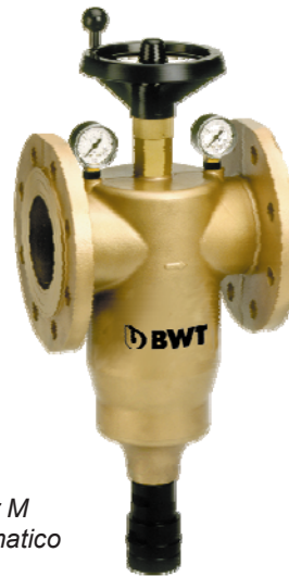
Multipur M Semiautomatico