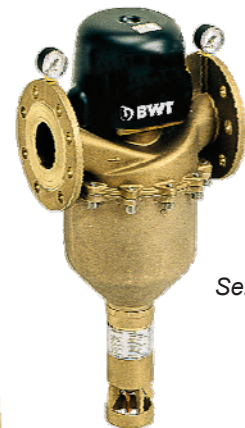
Multipur M Semiautomatico DN 100